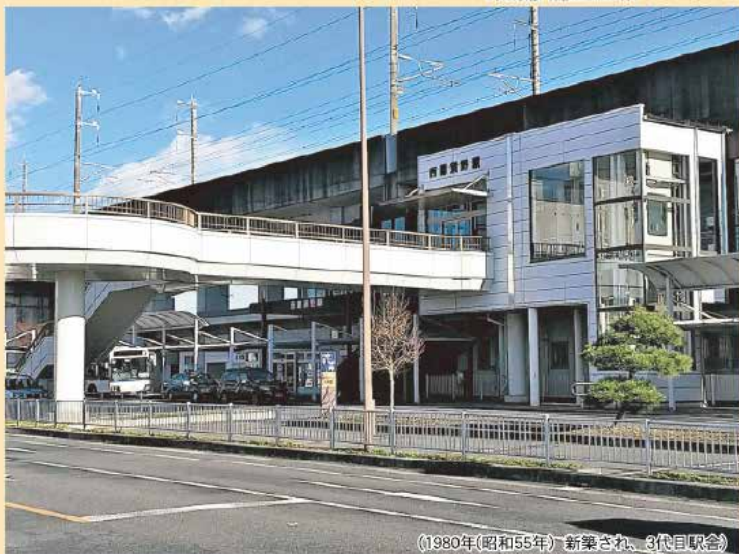
(1980年(昭和55年)新築され、3代目駅舎)