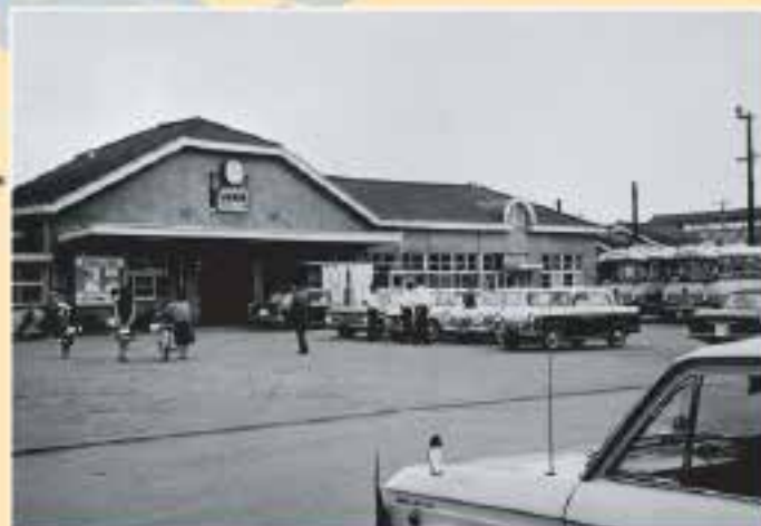
2代目駅舎、撮影は昭和40年代

現在の駅舎は、東北新幹線の建設とともに1980年(昭和55年)に新築され、3代目となります。平成21年度の駅西口広場整備事業により駅舎にエレベーターの設置、広場のロータリー化と歩道橋が作られ現在の形になりました。